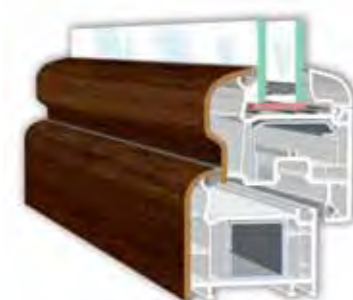
Perfectline-Swing skrzydło półzlicowane