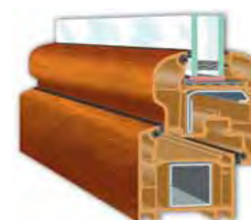
Perfectline-Oval skrzydło półzlicowane