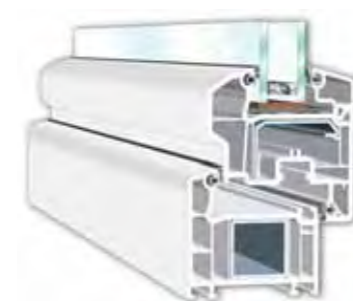
Perfectline skrzydło półzlicowane